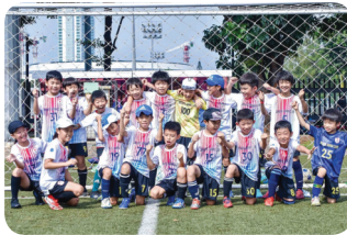
JJC Junior Soccer Club