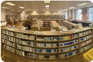
JJC Senayan Center (Library & Member Lounge)