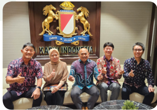
MoU with KADIN (HRD Committee)