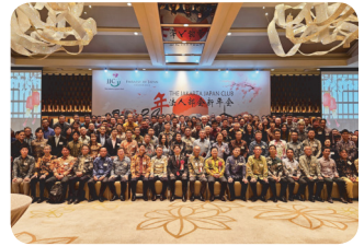
JJC Corporate New Year Party