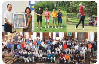
JJC Golf Events