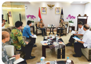
Discussion with Minister of Transportation