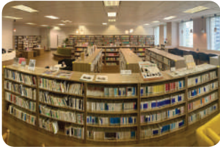
JJC Senayan Center (Library & Member Lounge)