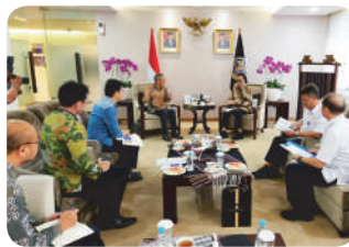
Discussion with Minister of Transportation