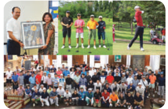
JJC Golf Events