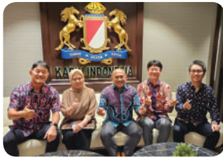
MoU with KADIN (HRD Committee)