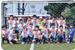
JJC Junior Soccer Club