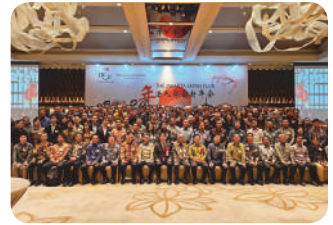
JJC Corporate New Year Party